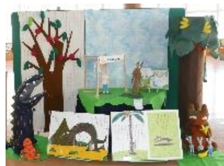
(絵本の読み聞かせ会)