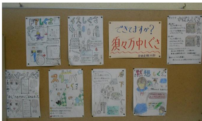
各しぐさについては校内の随所に掲示して意識化