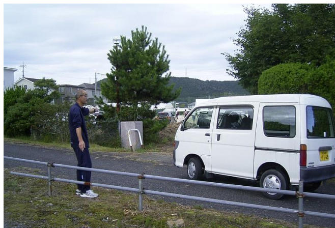
駐車場整理は地区委員