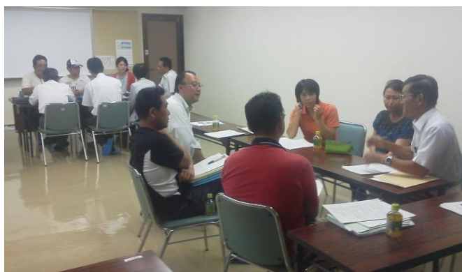
小中合同学校運営協議会。あいさつ活性化についての熟議

今年度は、小中合同学校運営協議会で、 あいさつ運動活性化のために「あいさつ標 語」を地域全体より募集することを決定し、 実際に募集・審査・表彰を行った。