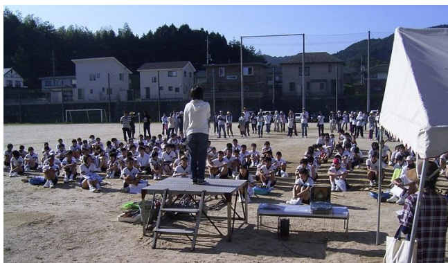
地域(部団)別に分かれての作業。PTA会長あいさつ。

8月にPTA学年委員会の主催で、校地内の清掃を生徒・保護者・地域と協力して実施する。校地が大変広いので、草刈り機や草運搬用の軽トラックを保護者や地域の方に提供していただいている。また、刈った草の処分も地域の方の私有地を利用させていただいており、保護者・地域が一体となって環境整備に尽力している。