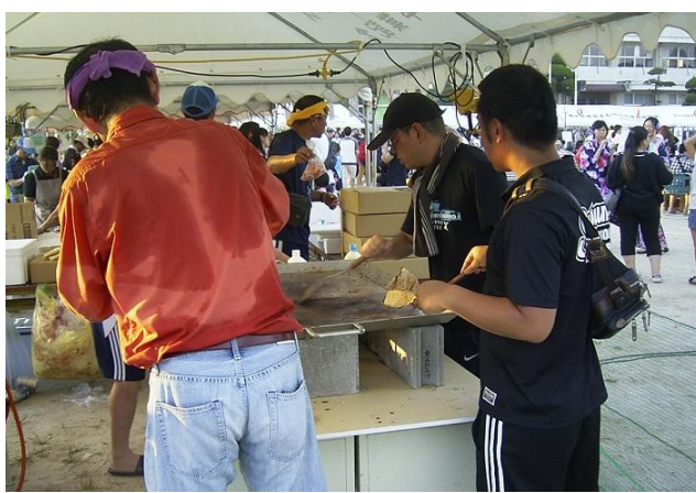
PTAバザーは焼きそばを担当。教職員も手伝いで参加。