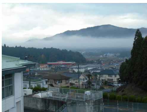
校舎 3 階から見た須々万盆地の雲海

古くから、瀬戸内と山陰を結ぶ交通の要地で、道路の整備に伴い、徳山・下松の市街地から車で 15 分、中国自動車道・鹿野 I C へも 20 分と交通のアクセスも良い。校区内には国の天然記念物「大玉杉」のある飛龍八幡宮をはじめ、沼城址など多くの史跡・名勝がある。