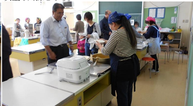
体育館の様子はモニターで中継。保護者も大助かり