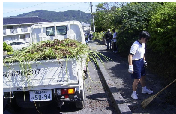
保護者や地域の協力はありがたい