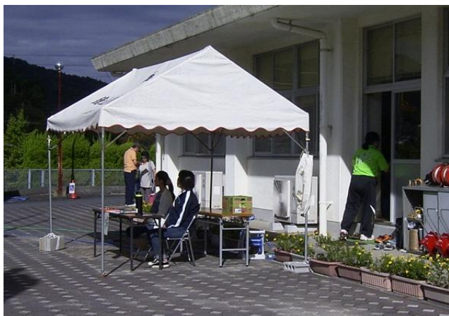
来賓受付は6役担当

PTAはバザー（保健体育委員会）、テント張り・駐車場整理（地区委員会）、広報用写真撮影（文化広報委員会）を協力する。