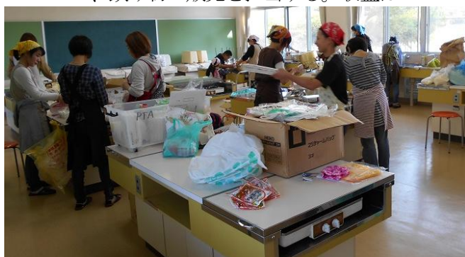
特製カレーは毎年評判

バザーを担当。主に6役、PTA役員、3年生で役員未経験者がカレー作りやハンバーガーやパン、飲み物の販売を担当する。収益はPTAの貴重な財源となる。