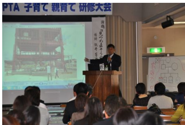
【坂井先生～南三陸町でのボランティアについて】

昨年の世相を表す漢字にもなった「絆」という字は、平安中期に馬をつなぐ綱から由来した言葉ですが、「糸」に「半分」と書き、「引く力、引かれる力」、それぞれが「相手のちから加減を考える」。そんな相手を「思いやる気持ちが大切」とであると、この様なときだからこそ、個々のちからの結集の「家族」と「コミュニティー(地域)」の尊さ、大事さを改めて認識。