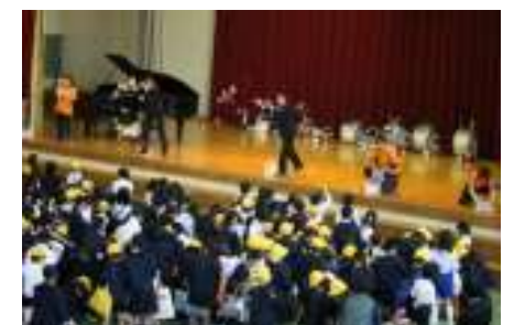
フィナーレ (餅まき)