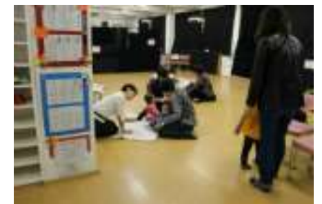
のんびりスペース