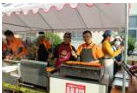
フランクフルト販売