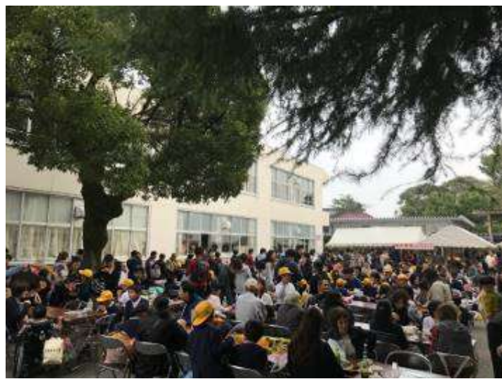
食事スペース（外会場）