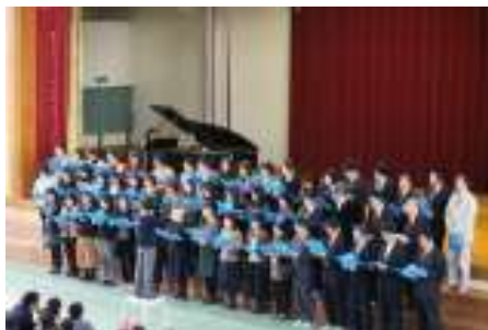
フィナーレ (教職員合唱)