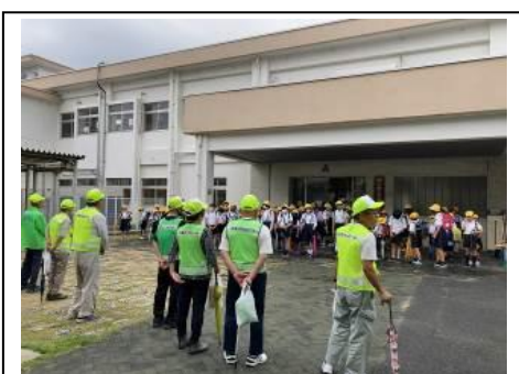
登下校時の見守り