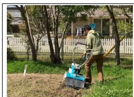
学校の畑のお世話