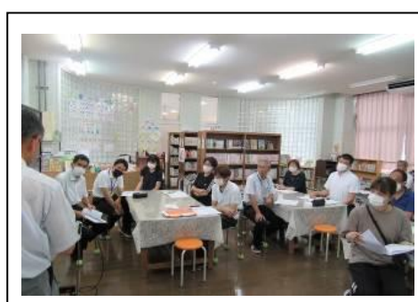
学校運営協議会での様子