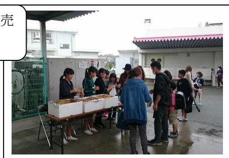
焼き鳥を販売する中学生