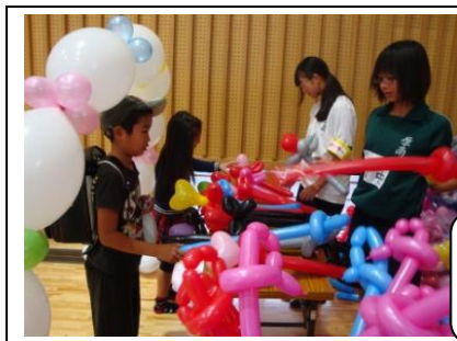
バルーンアートを上手に作る中学生