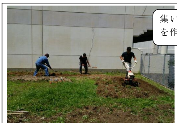
集いの場として「チーム南小畑」を作る会長・副会長・幹事