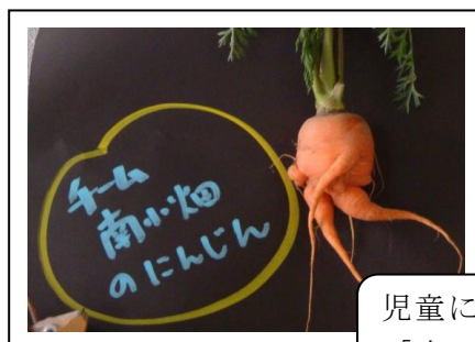
児童に話題を呼んだ「歩いているニンジン」