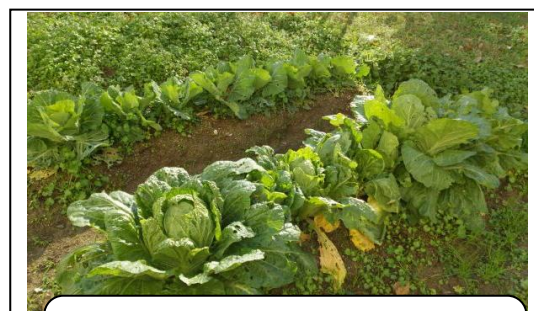
豚汁用の野菜を収穫後に植えた、冬野菜の白菜・キャベツ