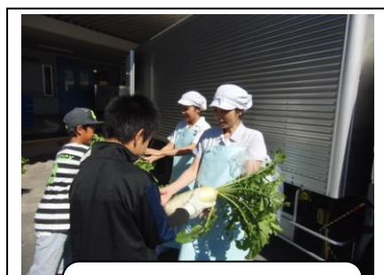
抜いた大根は給食室に持っていきました。