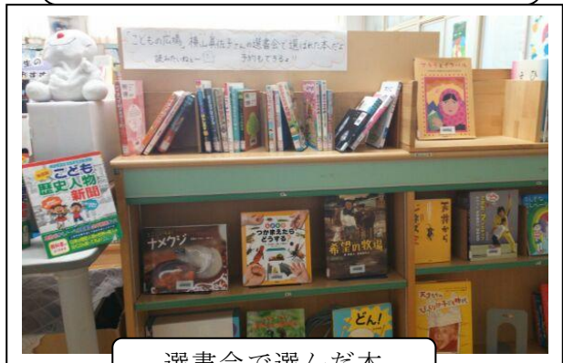
選書会で選んだ本