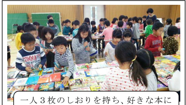
一人3枚のしおりを持ち、好きな本に挟んでいきます。