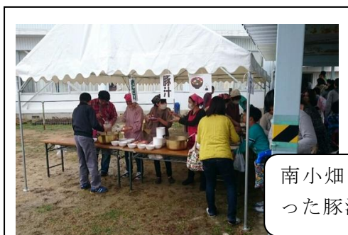
南小畑の野菜を使った豚汁の販売

同じく総務部が担当する豚汁コーナーでは、「チーム南小畑」で収穫したサツマイモ・ニンジン・サトイモを使った豚汁を振る舞った。