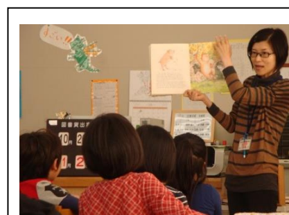
ブックトークに興味津津