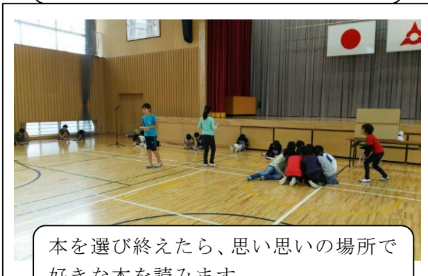
本を選び終わったら、思い思いの場所で好きな本を読みます。