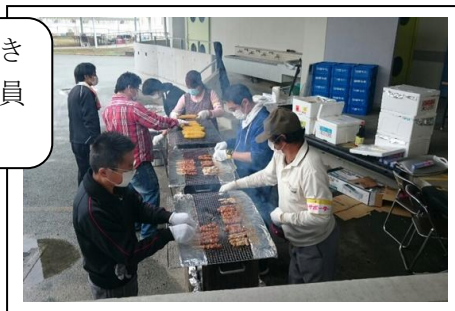
地域の方と焼き鳥を焼く協力員のお父さん