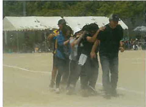
ムカデ競争にも参加しました。