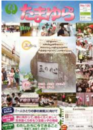
P T A 広報 1 学期