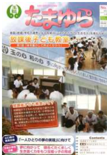
P T A 広報 2 学期